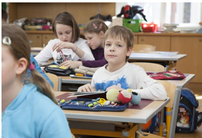
Volksschule Lutherschule Währing

Im Schuljahr 2014/15 werden an den Evangelischen Schulen der Diakonie Bildung rund 2.020 Kinder in 87 Klassen unterrichtet. Außerdem besuchen rund 1.300 SchülerInnen die Johann Sebastian Bach Musikschule bzw. die Pop Akademie, rund 800 Kinder nehmen unsere Angebote der Nachmittagsbetreuung in Anspruch.